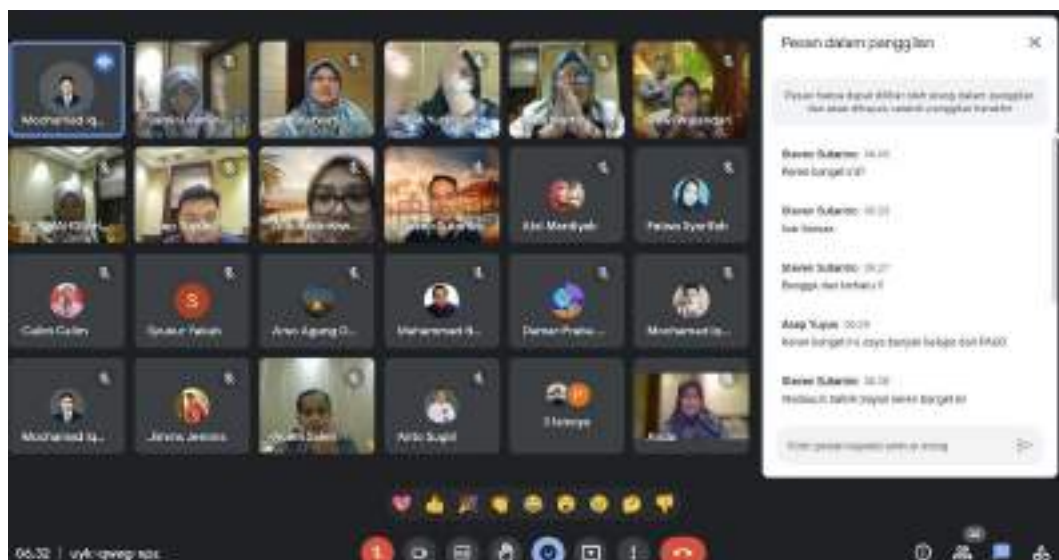
Gambar . Kegiatan Kemendikbudristek dimana praktik baik SaLink SaYanG di presentasikan.

SaLink SaYanG juga telah dipresentasikan sebagai salah satu produk penggunaan akun belajar.id dan Chrome Book di kegiatan Kemendikbudristek dan Coach/Trainerx Google dan mendapat Standing Ovation serta diminta untuk meneruskannya di semua Satuan Pendidikan bahkan lembaga karena sangat memudahkan dan sangat berdampak pada efisiensi kelembagaan.