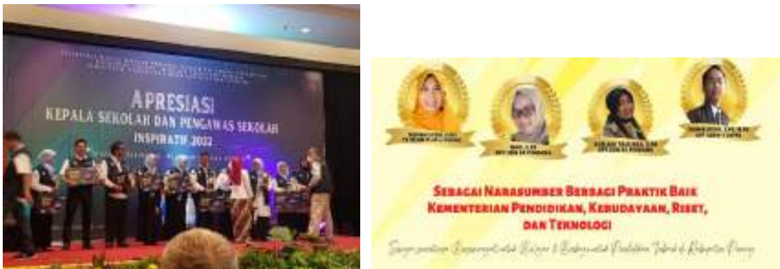
Gambar 3.8 Prestasi Guru Pinrang di Tingkat Nasional

Berbagai upaya ini berhasil mengantarkan sejumlah guru Kabupaten Pinrang menerima apresiasi di tingkat Nasional diantaranya menjadi narasumber berbagi praktik baik kementerian Pendidikan, Kebudayaan Riset dan Teknologi. 10 terbaik apresiasi Kepala Sekolah dan Pengawas Sekolah Inspiratif kategori Guru Taman Kanak – kanak, Pamong Belajar SKB, Kepala Sekolah Dasar dan Kepala Sekolah Taman Kanak – kanak.