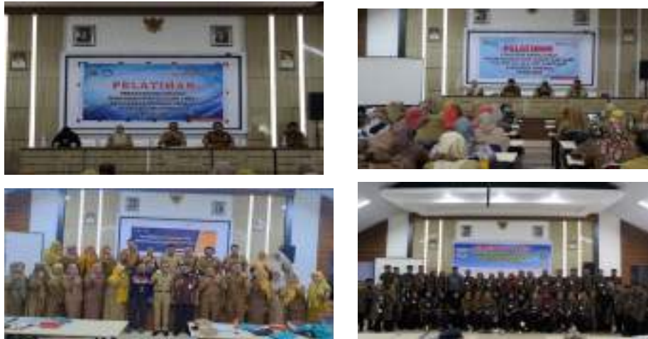
Gambar. 3.7 Berbagai Pelatihan yang diselenggarakan Pemkab. Pinrang dalam Rangka meningkatkan Kompetensi Guru.

Berbagai upaya ini berhasil mengantarkan sejumlah guru Kabupaten Pinrang menerima apresiasi di tingkat Nasional diantaranya menjadi narasumber berbagi praktik baik kementerian Pendidikan, Kebudayaan Riset dan Teknologi. 10 terbaik apresiasi Kepala Sekolah dan Pengawas Sekolah Inspiratif kategori Guru Taman Kanak – kanak, Pamong Belajar SKB, Kepala Sekolah Dasar dan Kepala Sekolah Taman Kanak – kanak.