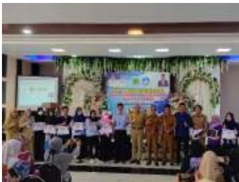
Gambar 3.3. Penyerahan Penghargaan bagi Operator Dapodik dengan Data Terbaik Kab. Pinrang

Berbagai upaya ini tidak hanya meningkatkan mutu pelayanan sekolah tapi juga mengantarkan sekolah mendapatkan apresiasi dari pemerintah pusat diantaranya Kelompok Bermain (KB) dan Tk Islam Plus eSchool Kab. Pinrang menjadi satu-satunya perwakilan Pulau Sulawesi ke Tingkat Nasional untuk Gerakan Nasional Pembelajaran Aku Anak Jujur (GERNAS MANJUR) yang dilaksanakan oleh Komisi Pemberantasan Korupsi (KPK dan Himpunan Pendidikan Anaka Usia Dini Indonesia ( HIMPAUDI).