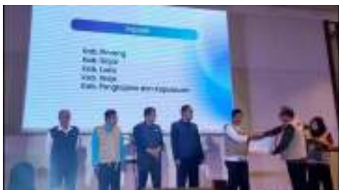
Gambar. 3.3 Penerimaan Penghargaan Kabupaten dengan Sikonronisasi Dapodik Tertinggi.