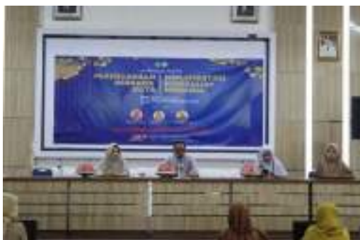
Gambar. 3.4 Bimbingan Teknis Perencanaan Berbasis Data dan Implementasi Kurikullum Merdeka