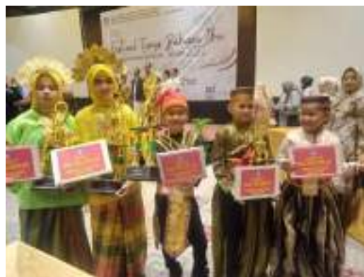
Gambar 3.6 Festival Lomba Tunas Bahasa Ibu Tingkat Provinsi Sulawesi Selatan