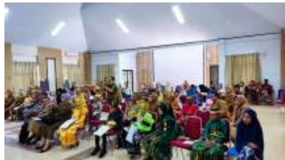
Bahasa Ibu Tingkat Kabupaten Pinrang