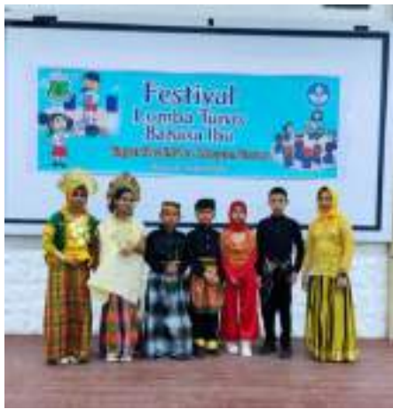
Gambar 3.5 Festival Lomba Tunas

Pemenuhan SPM bidang Pendidikan selanjutnya diupayakan dengan melaksanakan Pembinaan karakter peserta didik untuk mengembangkan karakter peserta didik agar menjadi sosok profil pelajar pancasila. Hal ini dilakukan dengan melaksanakan festival model pembelajaran bahasa dan sastra (tunas bahasa ibu) tingkat Kabupaten dan mengikuti Festival Tunas Bahasa Ibu se-Provinsi Sulawesi Selatan. Hasilnya Pelajar-Pelajar Kabupaten Pinrang berhasil mengukir prestasi dengan menjadi Juara 1 Puisi dan Juara 1 Pidato Putra, Juara mendongeng di tingkat provinsi. Para Pelajar ini selanjutnya mewakili Provinsi Sulawesi Selatan pada Festival Tunas Bahasa Ibu Tingkat Nasional.